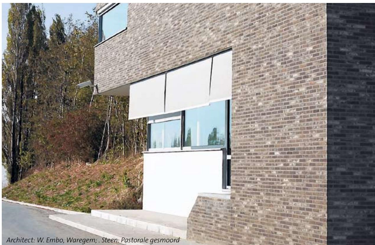
Architect: W. Embo, Waregem; . Steen: Pastorale gesmoord

De ruwe, oneffen textuur van de Wasserstrich Special-gevelstenen is het resultaat van een doordachte combinatie van materiaal (klei) en water. De verweerde, grillige look is een streling voor het oog en doet zowel Provençaals als robuust trendy aan, waardoor deze gevelstenen zich bijzonder goed